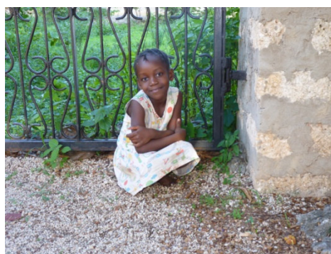
Agape im April 2012