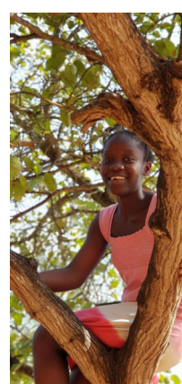
Agape in 2018