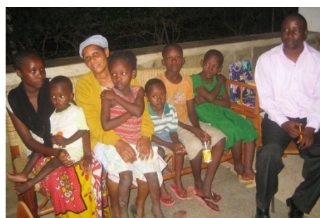
Ankunft in Nice-View 2011