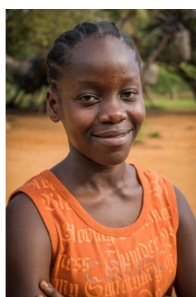
Agape in 2017