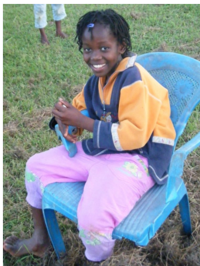
Agape in 2014