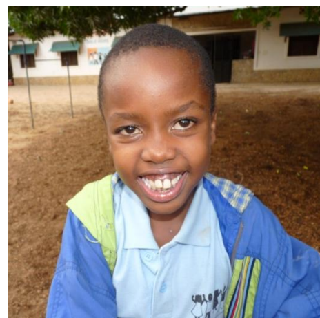
Amaton im April 2012