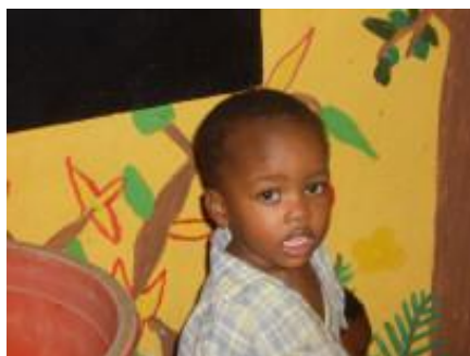
Amaton im März 2006