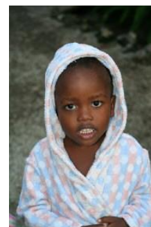
Amaton März 2007