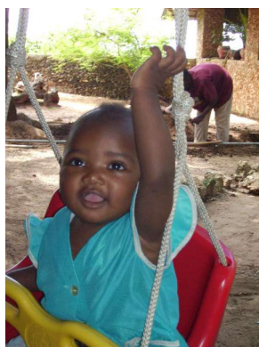
im Juli 2008