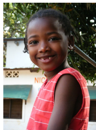
Caro in 2014