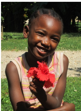
Caro in 2013