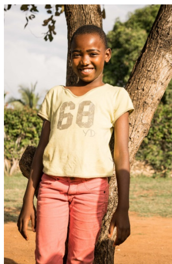
Caro in 2016