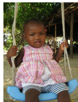
im November 2008