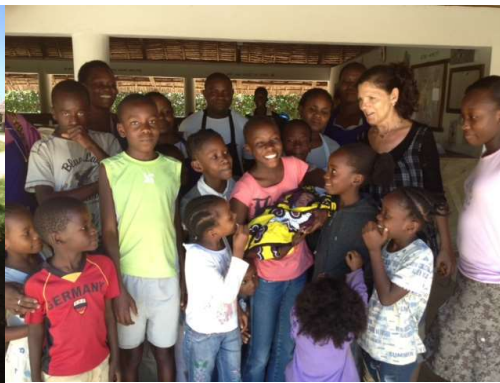
umringt von den Nice View Kids