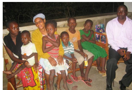
Ankunft in Nice-View