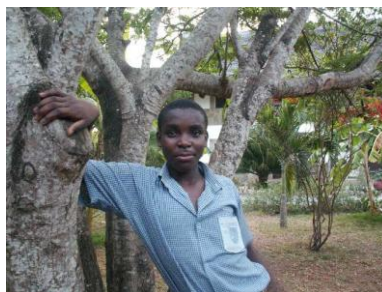
Francis Februar 2008