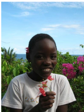
Lavenda im November 2008