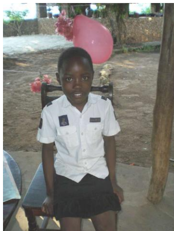
Lavenda im April 2008