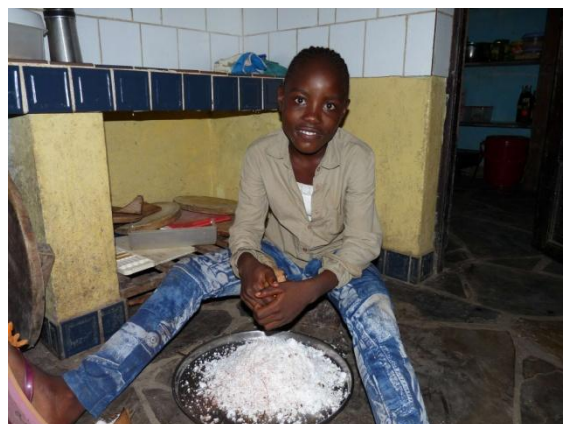
Lavenda im März 2009