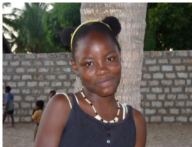
Lavenda im November 2011