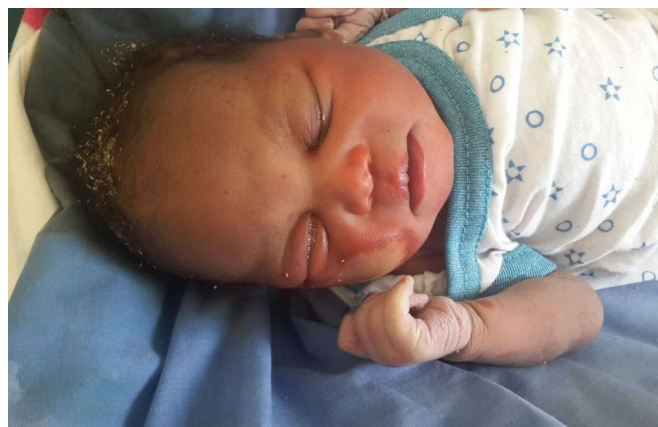
noch im Krankenhaus