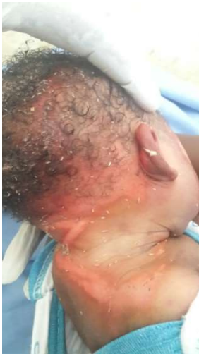
voller Maden bei ihrer Ankunft im Krankenhaus