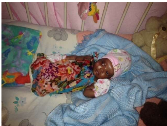
in ihrem Bettchen in Nice View