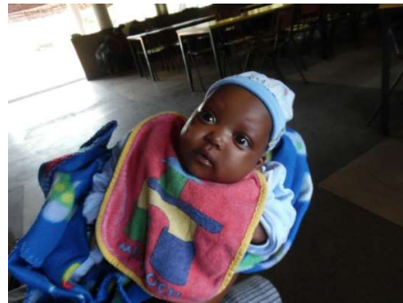
im September 2015

Unser Team in Nice View ist froh, hier wieder einmal helfen zu können und wir freuen uns alle über den Familienzuwachs.