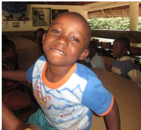
Tim Oktober 2013